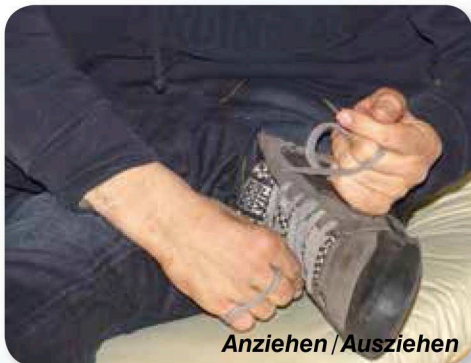
Anziehen / Ausziehen